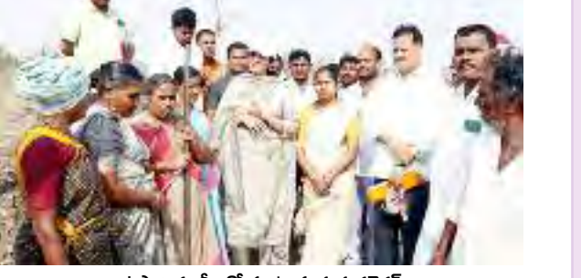
ఉపాధి కూలీలతో మాట్లాడుతున్న కలెక్టర్

■ కూలీల సంఖ్య పెంచేలా చర్యలు తీసుకోవాలి ■ ఉదయం 5:30 గంటలకే పనికి హాజరై, ఎండ తీవ్రత పెరిగేలోపు తిరిగి ఇంటికి వెళ్లాలి ■ నారాయణపేట జిల్లా కలెక్టర్ సీహెచ్ ప్రియంక నారాయణపేట, మే 23 ప్రభాతవార్త: నారాయణపేట జిల్లా ఉట్కూర్ మండల కేంద్ర సమీపంలో కొనసాగుతున్న ఉపాధి హామీ పనులను జిల్లా కలెక్టర్ సీహెచ్ ప్రియంక ఆకస్మికంగా తనిఖీ చేశారు. ఉట్కూర్ సమీపంలోని ఫీడర్ ఛానల్ పనుల వద్దకు వెళ్లి కలెక్టర్ అక్కడ పనిచేస్తున్న ఉపాధి కూలీలతో మాట్లాడారు. వేసవి తీవ్రతను దృష్టిలో ఉంచుకుని కూలీలు ఉదయం 5:30 గంటలకే పనికి హాజరై, ఎండ తీవ్రత పెరిగే లోపు తిరిగి ఇంటికి వెళ్లాలని సూచించారు. రోజువారీ కూలీ వివరాలను అడిగి తెలుసుకున్నారు. కూలీలకు కనీస వసతి సదుపాయాలు కల్పించడంతో పాటు తాగునీరు అందుబాటులో ఉంచాలని, తరచూ నీరు తాగాలని ఏపీహెచ్ సూచించారు. ఈ సందర్భంగా కూలీలకు ఓఆర్ఎస్ ప్యాకెట్లను పంపిణీ చేశారు ఉట్కూర్ పెద్ద గ్రామపంచాయతీ కావడంతో ఉపాధి పనులకు కనీసం 150 మంది కూలీలు ఉండేలా చర్యలు తీసుకోవాలని