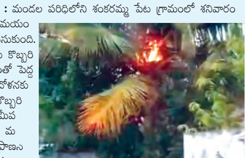
కొబ్బరిచెట్టుపై పిడుగు పడడంతో చెట్టు కాలిపోతున్న దృశ్యం

మదనాపూర్, మే 23 ప్రభాతవార్త : మండల పరిధిలోని శంకరమ్మ పేట గ్రామంలో శనివారం సాయంత్రం కురిసిన భారీ వర్షం సమయంలో పిడుగు వడిన ఘటన చోటు చేసుకుంది.