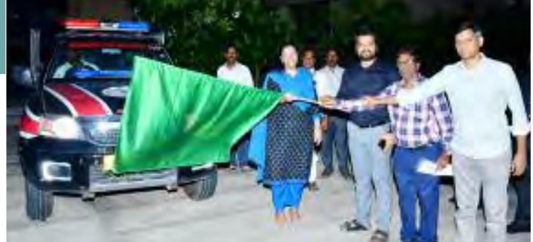
ప్రచార రథాన్ని జెండా ఊపి ప్రారంభిస్తున్న జిల్లా కలెక్టర్