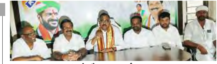
సమావేశంలో మాట్లాడుతున్న ఎంపీ మల్లు రవి