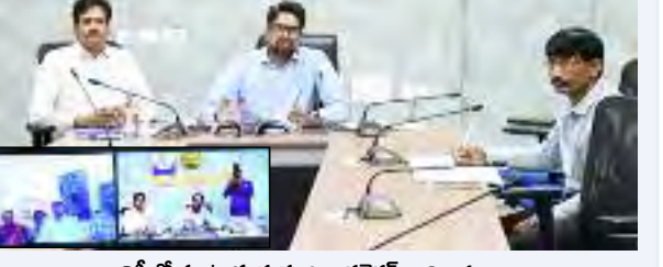
వినోల్ మాట్లాడుతున్న జిల్లా కలెక్టర్, అధికారులు

వనపర్తి, మే 23, ప్రభాతవార్త: జనగణన 2027 లో భాగంగా ఒక్క ఇంటిని కూడా మిస్ చేయకుండా ఇండ్ల గణన ప్రక్రియ నిర్దిత గడువులో పూర్తి చేయాలని జిల్లా కలెక్టర్ ఆదర్శ సురభి ఆదేశించారు. జిల్లా కలెక్టర్ ఆదర్శ సురభి శనివారం కలెక్టర్ల కాన్ఫరెన్స్ హాల్లో మీడియా కాన్ఫరెన్స్ ద్వారా సెప్టెం-2027 ఇండ్ల గణన ప్రక్రియపై వార్షిక అధికారులు, అదనపు జాబ్ అధికారులు, సూపర్ వైజర్లతో సమావేశం నిర్వహించారు. ఈ సందర్భంగా కలెక్టర్ మాట్లాడుతూ ఇంఫార్మ్ అధికారులు అందరూ ఎన్యూమరేటర్లతో సమన్వయం చేసుకుంటూ ఇండ్ల గణన ప్రక్రియను -మిగతా4లో..