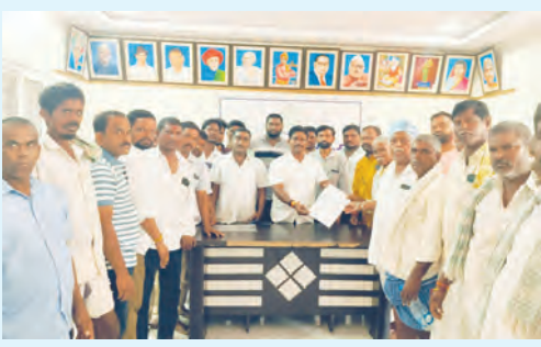
వేలం పాటను ఆపాలని వినతి పత్రం అందజేస్తున్న దృశ్యం