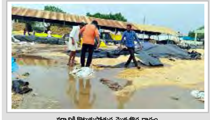
వర్షానికి కొట్టుకుపోతున్న మొక్కజొన్న ధాన్యం

ఎలాంటి పరతులు లేకుండా విరాళం చేసి విధంగా చర్యలు చేపడుతున్నామన్నారు. అన్నం పెట్టే రైతులకు ప్రతి ప్రభుత్వ కార్యాలయంలో గౌరవించే విధంగా ప్రణాళిక సిద్ధం చేస్తున్నామన్నారు. ప్రజావాణిలో ప్రజల నుండి తీసుకునే సమస్యలు వారంలోగా పరిష్కరించే విధంగా ప్రతి శాఖ అధికారులకు మాట్లాడతారన్నారు. ఎమ్మెల్యే డా. వంశీకృష్ణ మాట్లాడుతూ మొక్కజొన్న కేంద్రాల వద్ద కొంత ఇబ్బందులు జరుగుతున్నాయని రైతులకు సరిపడే గన్నా బ్యాగులు విషయంలో రవాణా విషయంలో రోడ్డు పాటులను తీర్చేందుకు అన్ని ఏర్పాట్లు చేస్తున్నామని తెలిపారు. ముఖ్యంగా స్టోరేజీ చేసుకునే గోదామలు లేక కాటన్ మిల్లులు ఇతరత్రా బిల్డింగులు తీసుకొని రైతులకు ఇబ్బందికాకుండా కొనుగోలు ప్రత్యేకంగా జరుగుతుందన్నారు. ఇక్కడ హామీల కొరత ఉండడంతో టీవర్ నుంచి హామీలను తెప్పించామన్నారు. ఇప్పటికే 8572 సెంటర్లలో రైతుల నుండి రూ.48 లక్షల మెట్రిక్ టన్నుల మొక్కలు కొనుగోలు చేయడం జరిగింది 9,55,000 మెట్రిక్ టన్నుల రైతులకు అందించడం జరిగింది అన్నారు. దేశ ప్రధాని మోడీ మక్కలను కొనడని అమెరికా నుండి రూ. 1200లకు కింగ్ టాల్ చొప్పున కొంటున్నారు. అదే తెలంగాణ రాష్ట్ర ప్రభుత్వం రూ .2400 రైతులకు చెల్లిస్తుందన్నారు. ఈ కార్యక్రమంలో గోపాల్ రెడ్డి, రామనాథం, మల్లేష్, తదితరులు పాల్గొన్నారు.