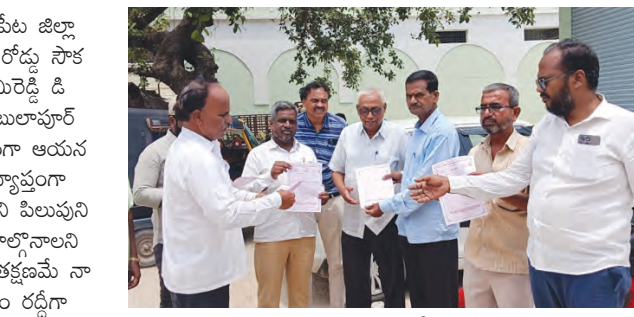
కరవత్రాసు విడుదల చేస్తున్న దృశ్యం