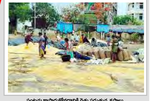
పంటను కాపాడుకోవడానికి రైతు పడుతున్న కష్టాలు

● ఆరుగలం పంట నీటిపాలయ్యే.. ● అరి గోసపడుతున్న రైతన్నలు ● త్వరగా మక్కలు కొనుగోలు చేయాలని రైతుల రోదన అన్నంపేట, మే, 23 ప్రభాతవార్త: ఆరుగలం కష్టపడి పండించిన పంట కళ్ళముందే నీటి పాలు అవుతుంటే గుండె రోదనతో రైతులు కన్నీరు పెట్టుకుంటున్నారు. వ్యవసాయ మార్కెట్లకు మక్కలు తెచ్చి నెల దాటిన కొనకపోవడం కాటం అయిన బ్యాగులను తరలించడంలో పూర్తిగా ప్రభుత్వం విఫలమైందని రైతులు ఆవేదనతో మాట్లాడుతున్నారు. ఒక వక్క పంట పడుతుంటే కళ్ళముందే పండించిన పంట నీళ్ళలో కొట్టుకుపోతుంటే రైతులు విలవిలలాడుతున్నారు. శుక్రవారం సాయంత్రం పట్టణంలో కులిసిన భారీ వర్షానికి వ్యవసాయ మార్కెట్లో అరబిసిన మక్కలు కొట్టుకోవాలి అన్నారు. అక్కడికి చేరుకున్న రెవెన్యూ అధికారులు వివేచనపూరితంగా అధికారులు, పోలీసు వ్యవస్థ రైతుల ప్రశ్నలను ఎంత ప్రయత్నించినా ఫలితం లేకుండా పోయింది. ప్రత్యామ్నాయంగా -మిగతా4లో..