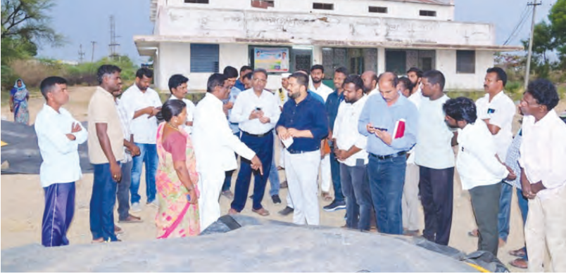
రైతులతో మాట్లాడుతున్న కలెక్టర్ హేమంత్ శేఖర్ పాటిల్

రైతులకు ఇబ్బందులు లేకుండా ధాన్యం కొనుగోలు చేయాలి... -జిల్లా కలెక్టర్ హేమంత్ శేఖర్ పాటిల్