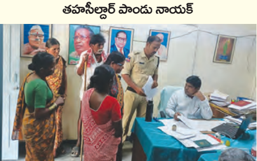
తహసీల్దార్ కార్యాలయంలో బైండోవర్ కేసులు

నాలుసారా విక్రయస్థి కలిసిన చర్యలు తీసుకుంటాం