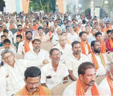
హాజరైన హిందు బంధుజనం